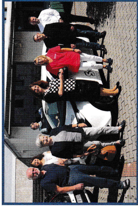
Übergabe eines neuen - vom Förderverein finanzierten - Dienstwagens

(Vereinsregister Amtsgericht Darmstadt VR 30762)